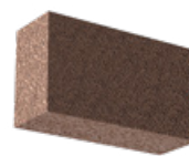
L x B x H in cm: 12,3 x 42,5 x 24,8 7 DF