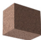
L x B x H in cm: 17,5 x 30,0 x 24,8 Ergänzungsstein