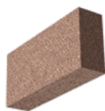
L x B x H in cm: 49,0 x 11,5 x 24,8 8 DF Bauplatte