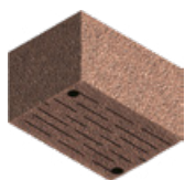
L/B oder B/L x H in cm: 42,5/30,0 x 24,8 Eckstein